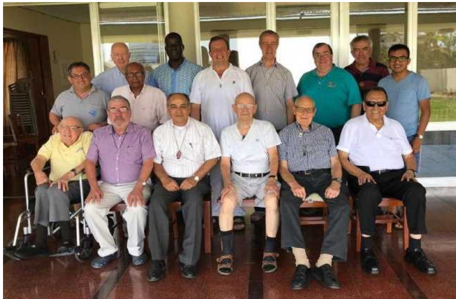
ペルー地区の会員 総長評議員とともに

2月19日から3月12日にかけて、総長評議員会4名のメンバーがペルー地区を訪問しました。彼らはコロンビアのボゴタからその訪問を終えて一緒に到着しました。